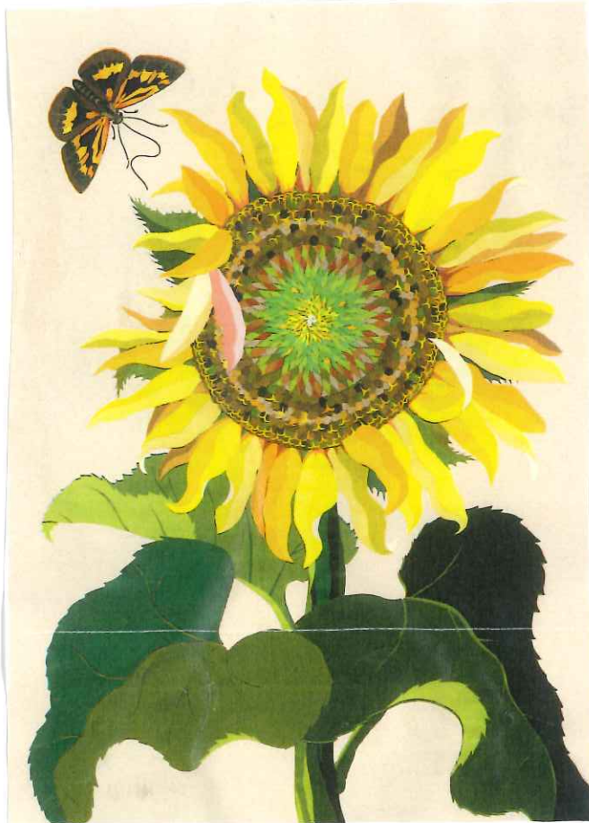
(ヒマワリとキマダラセリ) 切り絵 今森光彦

貸し出しをいたしますので、担任に言われてください。ゆっくり、じっくり。お家の方からの絵本の読みかたりは、子どもの身に届いていくと思います。 どの絵本も 絵本はあまり抑揚をつけず、淡々と読んであげたほうが、身に沁み入っていき、 よくよく 根っこのしつになります。毎日、同じ絵本、好きな絵本をくり返し読んであげてください。 子どもさんのおぼろの絵本でできます